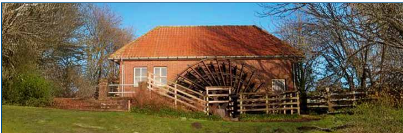
HET GEMAAL BROEKEN EN MATEN, KAMPEN