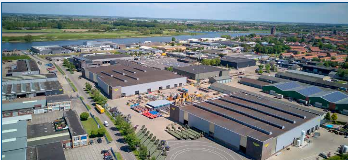
BROSHUIS BV, KAMPEN

Noteer dit evenement alvast in uw agenda, verdere info volgt zo spoedig mogelijk.